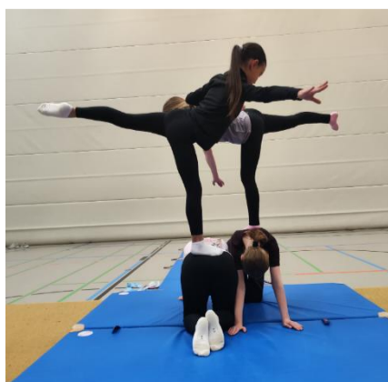
Akrobatikprojekt in Klassenstufe 5