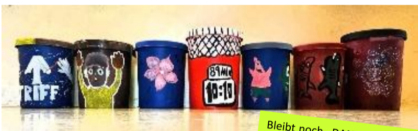
Nachhaltigkeitsprojekt: bemalte Mülleimer